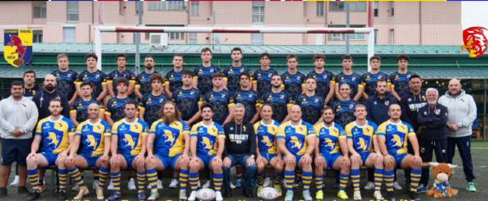
VII Rugby Torino- Campionato Nazionale Serie A- s.s. 2024/25